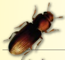
Gorgojo de los cereales Tribolium, spp

Por su composición a base de piretrinas naturales, GRANET® protege granos de CEREALES (trigo, cebada, maíz, etc.), legumbres (judías, garbanzos, lentejas, etc.), patatas, sémolas y semillas, contra ataques de gorgojos, polillas y otros insectos de almacén, manteniendo la riqueza alimenticia y propiedades organolépticas de las sustancias tratadas y reduciendo al mínimo las mermas de peso.