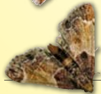
Polilla de la harina Plodia, spp