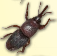
Gorgojo de los cereales Sitophilus granarius